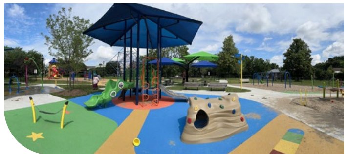
Aire de jeux accessible Allan J. Levine dans le parc Kirwan.

À Côte Saint-Luc, l'accessibilité c'est la création d'une communauté inclusive où les services permettent à tous de participer pleinement, sans obstacle. Notre objectif est de nous adapter et nous développer en matière d'accessibilité et d'inclusivité afin de servir adéquatement la population aux besoins diversifiés. Les services qui mettent en œuvre ce mandat amélioreront la qualité de vie des résidents et des visiteurs qui utilisent les installations et participent aux programmes de loisirs proposés. La Ville espère également créer un environnement inclusif où les différences sont célébrées.