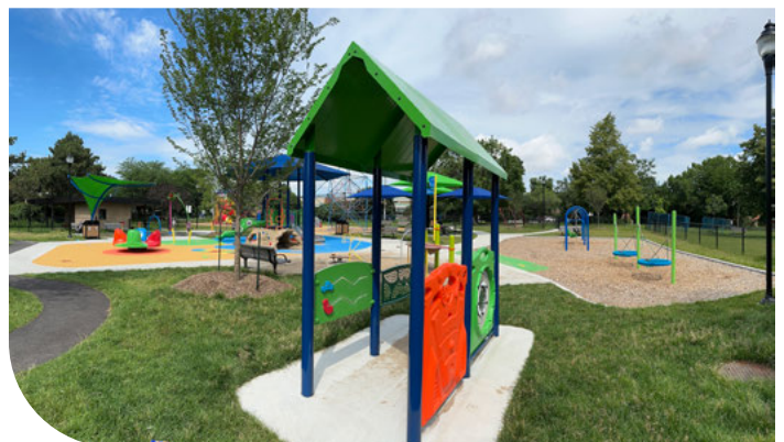
Aire de jeux accessible Allan J. Levine dans le parc Kirwan.

À Côte Saint-Luc, l'accessibilité c'est la création d'une communauté inclusive où les services permettent à tous de participer pleinement, sans obstacle. Notre objectif est de nous adapter et nous développer en matière d'accessibilité et d'inclusivité afin de servir adéquatement la population aux besoins diversifiés. Les services qui mettent en œuvre ce mandat amélioreront la qualité de vie des résidents et des visiteurs qui utilisent les installations et participent aux programmes de loisirs proposés. La Ville espère également créer un environnement inclusif où les différences sont célébrées.