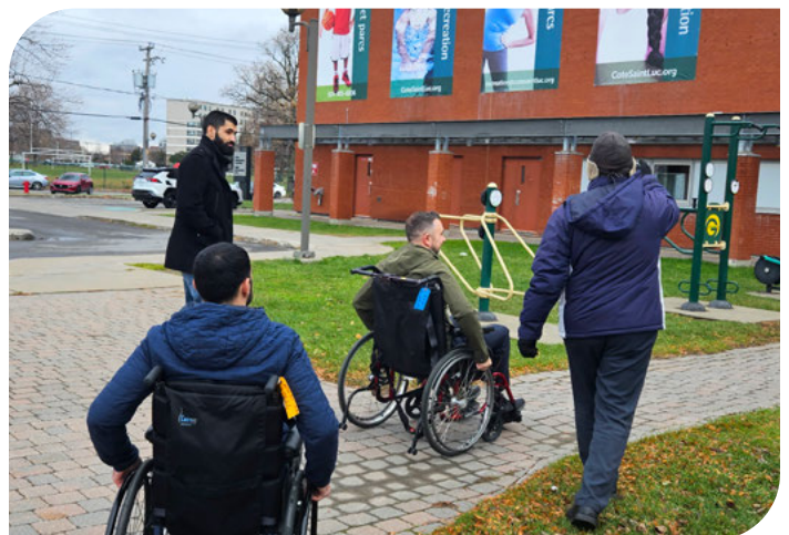
Personnel de la ville participant à une formation